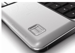
Leitor Biométrico de Impressão Digital