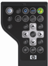
Controle Remoto HP 2.1 (Versão Express Card)