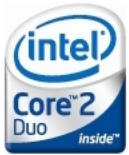
Processador Intel® Core™ 2 Duo (2)