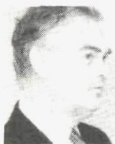
NORMAN LAMONT (48 años) Presidente del Ecofin