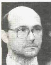
MICHEL SAPIN Ministro de Economía y Finanzas francés

El consejo de ministros de Economía de la CE, presidido por el titular británico de Hacienda, Norman Lamont, reiteró ayer el compromiso de la Doce de proseguir con los trabajos para la ratificación del tratado de Maastricht y se pronunció en contra de una Europa de dos velocidades. Los ministros, reunidos en Bruselas, se comprometieron a impulsar la convergencia de las respectivas economías. PÁGINA 67