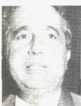
CARLO DE BENEDETTI (57 años) Presidente de Olivetti

La devaluación de la peseta ha provocado el encarecimiento de las importaciones españolas en general, y de las energéticas en particular. Como consecuencia de ello, Campsa ha incrementado a las cero horas de hoy el precio de la gasolina en dos pesetas. Con este aumento del precio, la gasolina súper se sitúa en 98 pesetas el litro, cifra que representa el máximo histórico alcanzado por la gasolina súper en España. PÁGINA 69